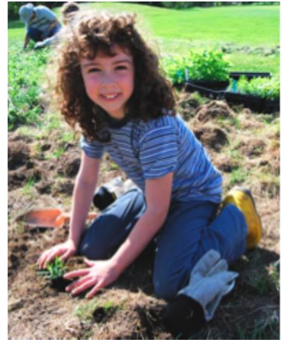
Une jeune EcoAmbassadrice

Monde = Actions locales pour un impact global