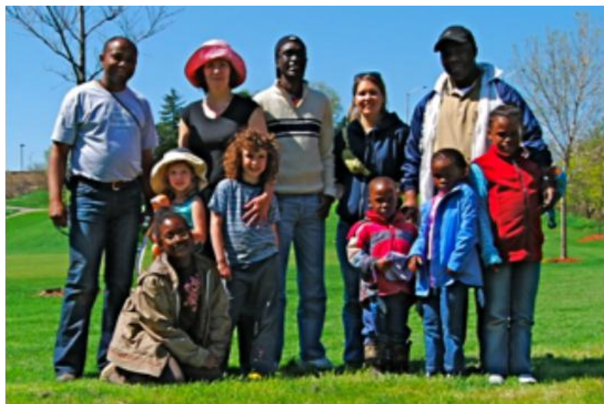
EcoAmbassadeurs lors de la création d'un golf écologique au Golf de Brampton