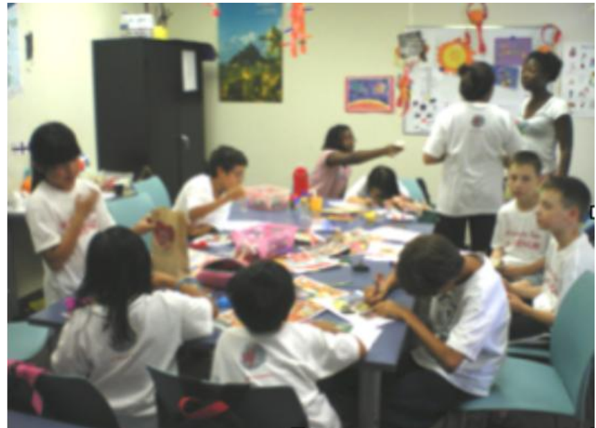
Intervention des EcoAmbassadeurs lors des camps d'été de l'Alliance française de Toronto