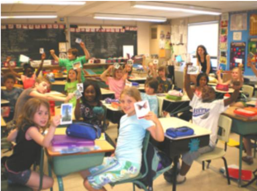
Elèves de 3 ème année de l'école Georges-Etienne-Cartier lors d'une intervention des EcoAmbassadeurs