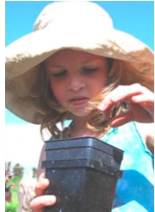
Une jeune EcoAmbassadrice