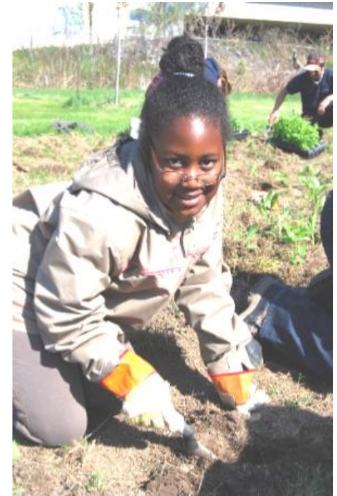
Une jeune EcoAmbassadrice