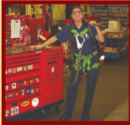
Les élèves acquièrent des compétences en milieu de travail

Qui travaillera pour vous dans les dix prochaines années? Des chiffres récents indiquent qu'il est de plus en plus difficile pour les entreprises de trouver du personnel qualifié. Selon l'enquête de la Fédération canadienne de l'entreprise indépendante (FCEI) sur la pénurie de main-d'œuvre menée en 2003, le Canada comptait 265 000 postes à temps plein vacants en raison d'un manque de candidats qualifiés.