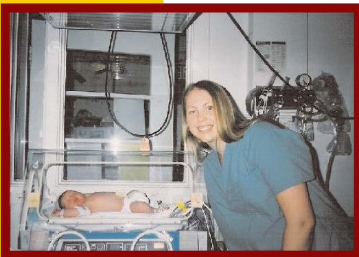
Étudiante du programme d'éducation coopérative du système sur les soins de santé du Niagara

Les pages du présent bulletin contiennent des exemples de la manière dont certains employeurs de l'Ontario font de l'alternance travail-études une réussite concluante. Pour des renseignements complémentaires sur le démarrage d'un régime travail-études dans votre entreprise, visitez le site Web Passeport pour la prospérité : www.edu.gov.on.ca/passport .