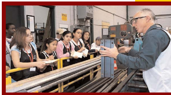
Journée Invitons nos jeunes au travail à Toronto Hydro