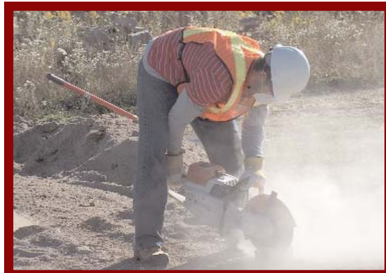
Les élèves du programme d'éducation coopérative en horticulture acquièrent une expérience précieuse